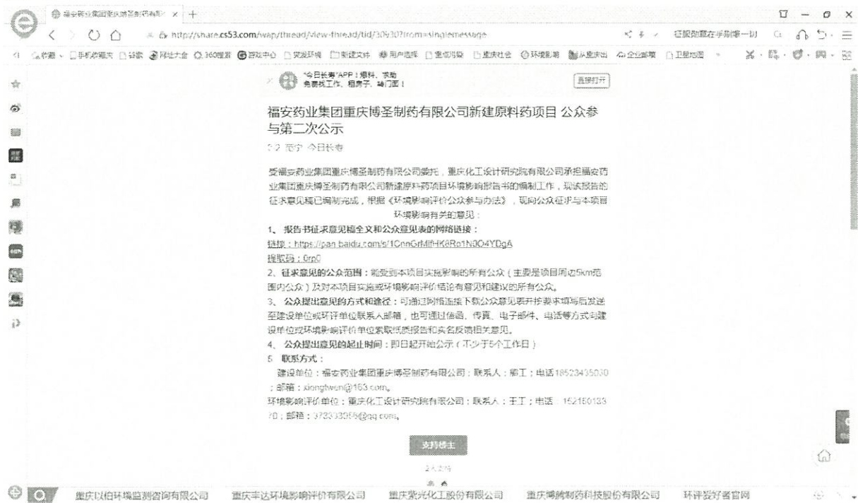
图3.2-1 环境影响报告书征求意见稿公示截屏

环境影响报告书征求意见稿公开时间为2020年2月3日至2020年2月21日，公示链接为： http://share.cs53.com/wap/thread/view-thread/tid/30930?from=singlemessage 。公示截屏如图3.2-1。