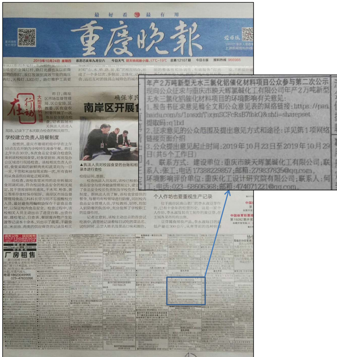
图 2.2-2 2019 年 10 月 24 日报纸公示照片