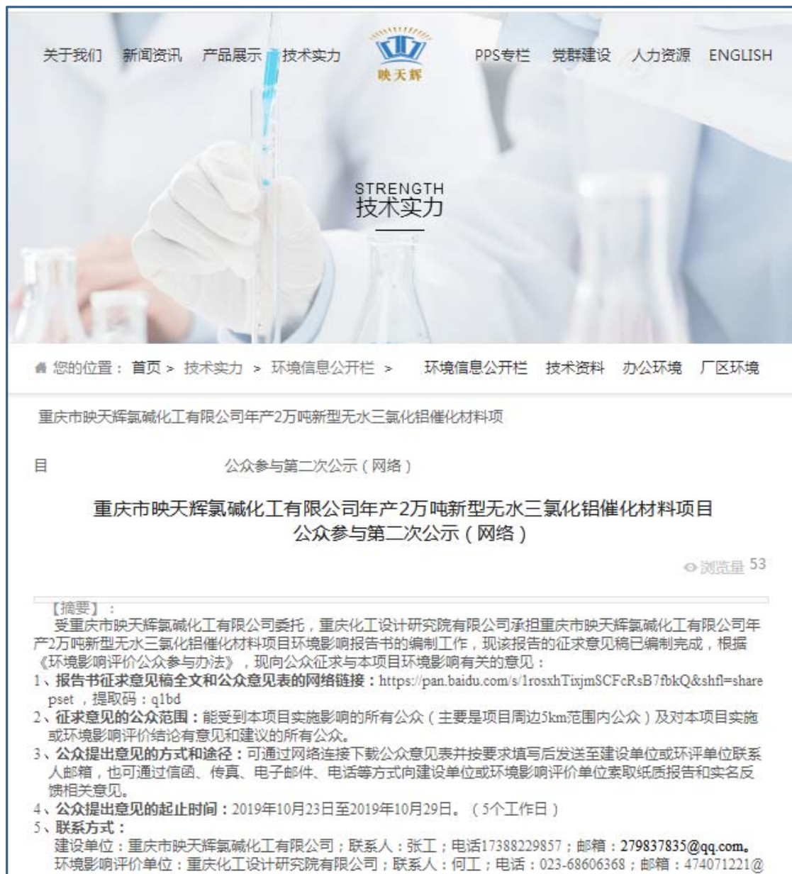
图 2.2-1 环境影响报告书征求意见稿公示截屏